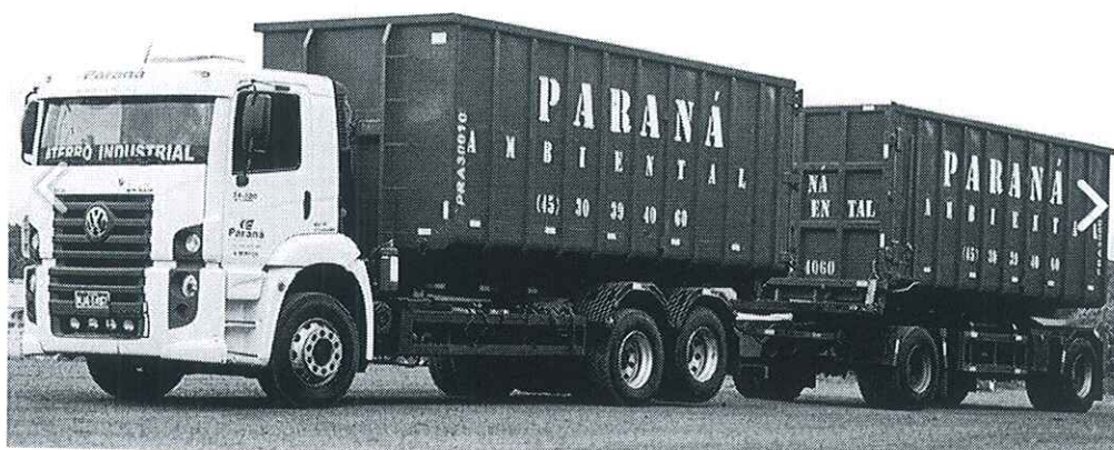
Roll on/off com Julieta: 70 m 3

Os resíduos serão acondicionados em contêineres com capacidade de 5 a 35 m 3 cada. A segregação dos resíduos é de responsabilidade do gerador.