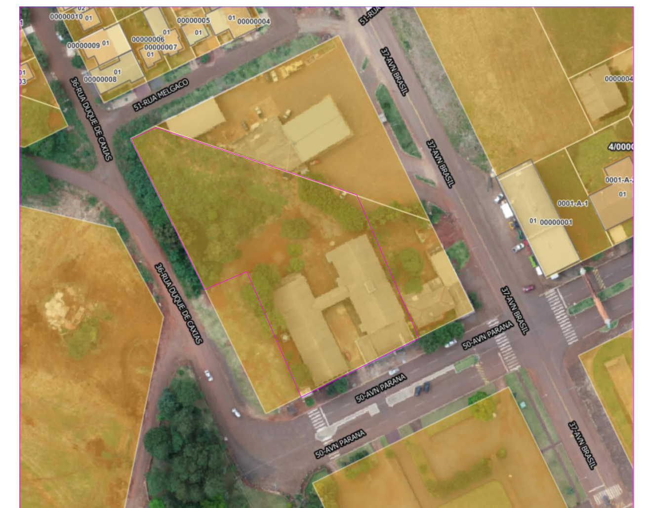
LOCALIZAÇÃO OBRA SEM ESCALA