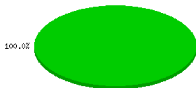
(B) - Média Mensal de Renúncia